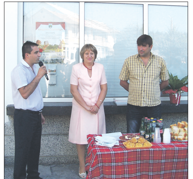
Кметът на града Мердин Байрям поздравя кооперацията с откриването на магазина